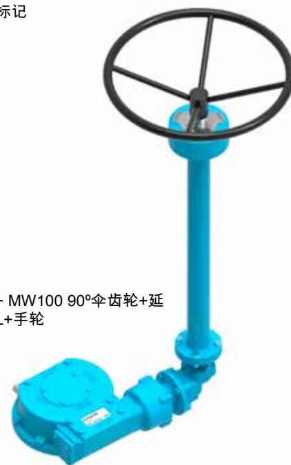
E1950G + MW100 90°伞齿轮+延长轴+ECL+手轮