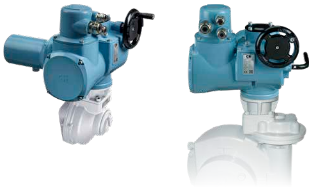
Napęd serii CK z przekładnią

Bazy typu A mogą zostać odłączone od obudowy napędu w celu łatwej instalacji na armaturze. W przypadku konieczności demontażu napędu baza może zostać na armaturze. Wszystkie bazy mają przyłącza zgodne ze standardami ISO5210 lub MSS SP 102.