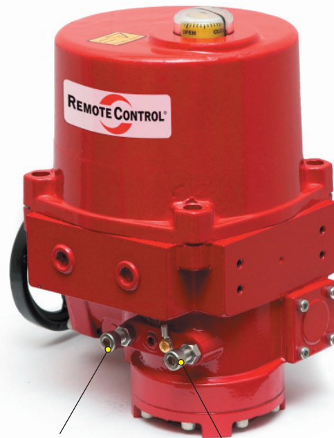
Vis de réglage ouverture

Le levier d'embrayage retourne automatiquement en mode automatique quand l'actionneur est commandé électriquement.